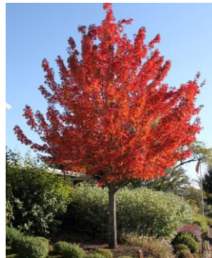
ဒေသပေါက်ပင်နှင့် သစ်မျိုးစိတ်များကို အဆိုပြုထားသော ရှုခင်းအစီအစဉ်တွင်ဖော်ပြသွားမည်ဖြစ်သည်။

ထိုအပန်းဖြေလမ်းသည် ဒေသပေါက်ပင်မျိုးစိတ်များနှင့် ဗားမောင့်ပြည်နယ်(Vermont)၏ အထင်ကရ ရှုခင်းများပါဝင်သော "ထိန်းသိမ်းရေးနယ်မြေ" တခုအဖြစ် ဖြစ်လာမည်ဖြစ်သည်။ ထိုကဲ့သို့ အယူအဆများနှင့်လမ်း၏ ရည်မှန်းချက်များထဲမှ တခုမှာ နယ်မြေအတွင်း ဆက်သွယ်မှု၊ ကျန်းမာရေးနှင့် ကျန်းမာရေးအသိတရားများ အားကောင်းစေမှုကို ဖန်တီးရန်ဖြစ်သည်။