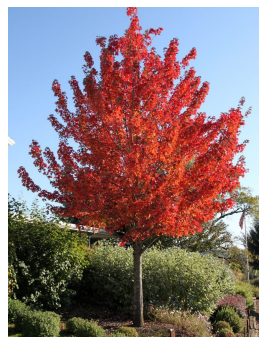
原植物和树种将被纳入拟议的整体景观规划。