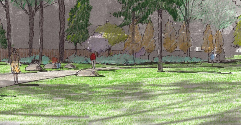
道路、植物和巨石环境透视草图