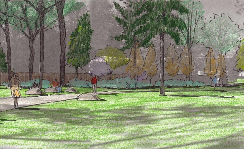
गोरेटो, बोट-बिरुवा और ढुंगा द्वारा निर्मित बैठक चित्रित दृश्यात्मक चित्रण